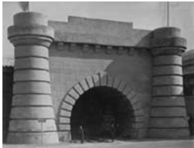
Einfahrt des Mont - Cenis - Tunnel

es zu einem Börsenkrach mit weitreichenden Folgen, allein an diesem Tag ereigneten sich 110 Insolvenzen. Als weitere Katastrophe auch für die Reputation Wiens als Ausstellungsstadt erwies sich der Ausbruch einer Choleraepidemie, die sich hemmend auf den Besucherstrom auswirkte. Die Epidemie grassierte zwar vorwiegend in den Elendsvierteln der Stadt, deren Wasserversorgung mangelhaft war (die Wiener Hochquellen-Wasserleitung wurde erst im Oktober 1873 fertiggestellt), doch hielt sie manchen potentiellen Besucher ab. Insgesamt besuchten bis zum 31. Oktober 1873 etwa 7,3 Millionen Menschen die Weltausstellung, was nicht ausreichte, um den Aufwand zu decken. Ein beachtliches Defizit | insgesamt 19 Mill.