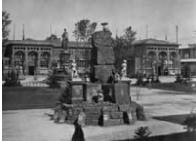
Im deutschen Hofe

Von den Kommentatoren sehr gelobt wurde der österreichische Schwerpunkt " Bildungswesen ", dessen soziale Gewichtung beeindruckte. Ebenso gefiel die Einbeziehung des zeitgenössischen Kunstschaffens. Für das Kunsthandwerk, dessen Leistungen traditionell bei Weltausstellungen mit zahlreichen Medaillen prämiert wurden, konnte eine positive Bilanz gezogen werden. Bei der berühmten Preisverleihung durch den Ausstellungsprotektor Erzherzog Karl Ludwig, einen Bruder des Kaisers, in der Winterreitschule wurden insgesamt an die 40.000 Medaillen, Diplome und Preise vergeben. Mit den Prämierungen waren