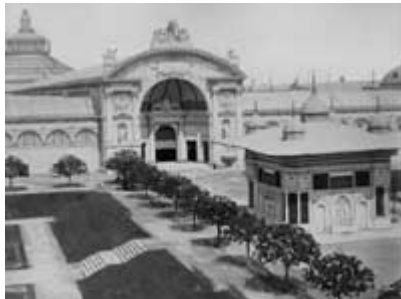
Ost-Portal des Industriepalastes mit Achmedbrunnen

ausgewirkt und wären sicherlich ohne die Weltausstellung erst viel später in die Tat umgesetzt worden. Diese Reformen begannen bei der Verkehrsplanung und der Inbetriebnahme neuer Linien der „ Pferdebahn “, gingen über die Schaffung von Luxushotels und Beherbergungsbetrieben der gehobenen Klasse zur Errichtung von neuen Brücken über den Donaukanal. Ein ganz wesentlicher Aspekt