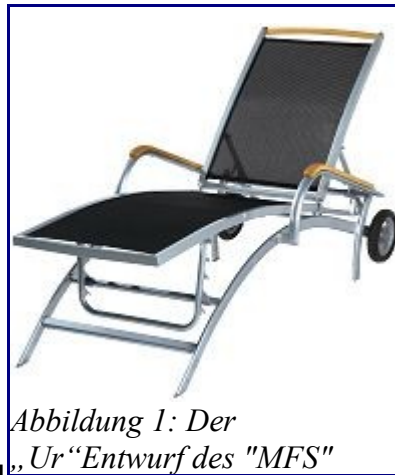
Abbildung 1: Der „Ur“Entwurf des „MFS“

Schließen dieser von innen verlief nicht so, wie ich mir das im Kopf ausgemalt hatte. Ich konnte mich in der Zelle nicht umdrehen, geschweige die Hosen herunterlassen. Also beschloß ich einen neuen Anrand zu nehmen. Wieder hinaus, Hose runter und verkehrt durch die Falttüre. Einen Happen mit Lachs steckte ich mir zur Sicherheit noch in den Mund. Man kann ja nie wissen. Was dann an Unannehmlichkeiten, aus Platzmangel, hier passierte, wird nie ans Licht der Öffentlichkeit dringen. Nur, daß sich an diesem Tag ein technischer Defekt ereignet hatte und es kein Wasser zum Händespülen gab, ließ mich etwas unsauber den Klobereich verlassen. Eine Flasche Mineralwasser von einem hilfreichen Engel, tats auch. Als ich wieder den schützenden Vorhang zum „Vippbereich“ beiseite schob, währte ich mich auf einem Schlachtfeld bei Nacht. Verdun, oder so. Überall lagen Leichenteile herum. Hier ein einsamer Arm, an dem ich hängenblieb, dann wieder ein herrenloses Bein, über das ich stolperte. Irgendwie erinnerte mich diese Szenerie an eine Prosektur mit Schlafgeräuschen. Aber es war schlicht und einfach ein „Wettschnarchen“. Einige Gesichter waren, durch die vermehrte Alkoholaufnahme, mehr als entstellt. Mir lag der Satz verteufelt auf der Zunge: „Irgendjemand zugestiegen“. Nur zu gerne hätte ich ihn rausgeschrien!